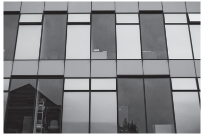
11. UFO Sint-Pietersnieuwstraat 33

Redactie: Fien Danniau Eindredactie: Ruben Mantels Beelden: Fien Danniau en Pieter Morlion Grafisch ontwerp: www.janenrandaald.be www.UGentPassage.be