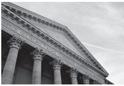
1. Aula Voldersstraat 9