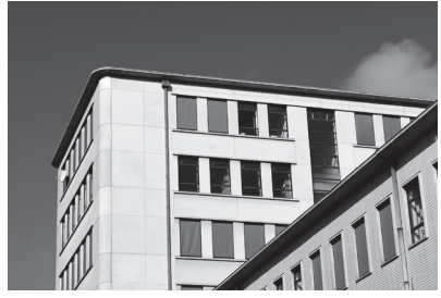
8. Blandijn Blandijnberg 2