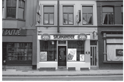
9. Overpoortstraat Overpoortstraat