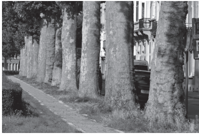
4. Coupure Brug over de Coupure, aan de plezierhaven