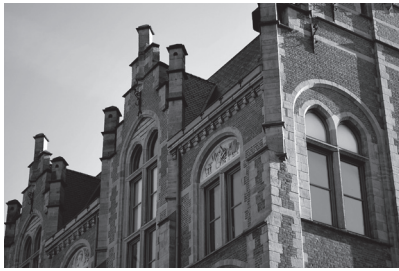
5. Rommelaere Kruispunt Hospitaalstraat en Jozef Kluyskensstraat