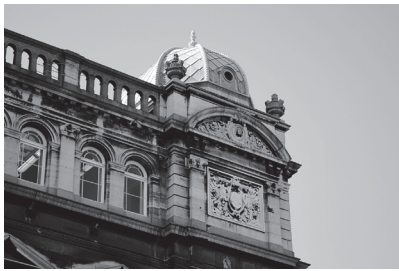
6. Plateau Jozef Plateaustraat 22