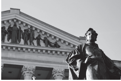
3. Justitiepaleis Koophandelsplein