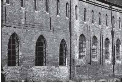
2. Het Pand Kruispunt Predikherenlei en Hornstraat, op het brugje over de Leie