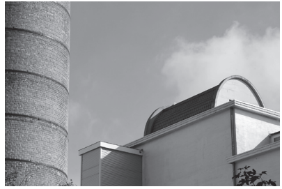
10. De Thermanal Hoveniersberg, aan het water