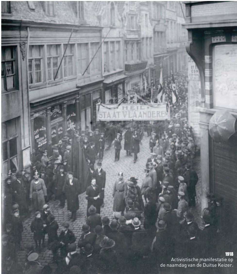
1918 Activistische manifestatie op de naamdag van de Duitse Keizer.

graag openhouden, met het Nederlands als voertaal. De Duitse generaal Moritz Ferdinand Freiherr von Bissing werd eind 1914 benoemd tot gouverneur van het Keizerlijke Duitse Generaal Gouvernement van België. Met zijn 'Flamenpolitik' voerde hij een bewust beleid om de radicale Vlamingen te behagen.'